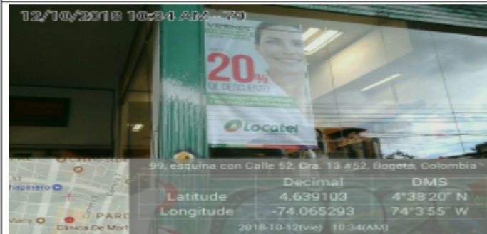
PUBLICIDAD EN VENTANAS