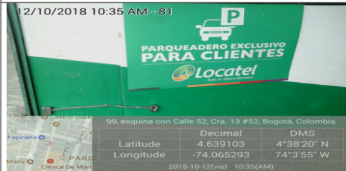
PUBLICIDAD EN PUERTAS